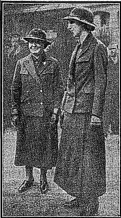
Les deux premières femmes-agents en uniforme

Les Parisiens verront désormais circuler dans leurs rues, à l'exemple de celles d'autres grandes capitales, des femmes-agents.