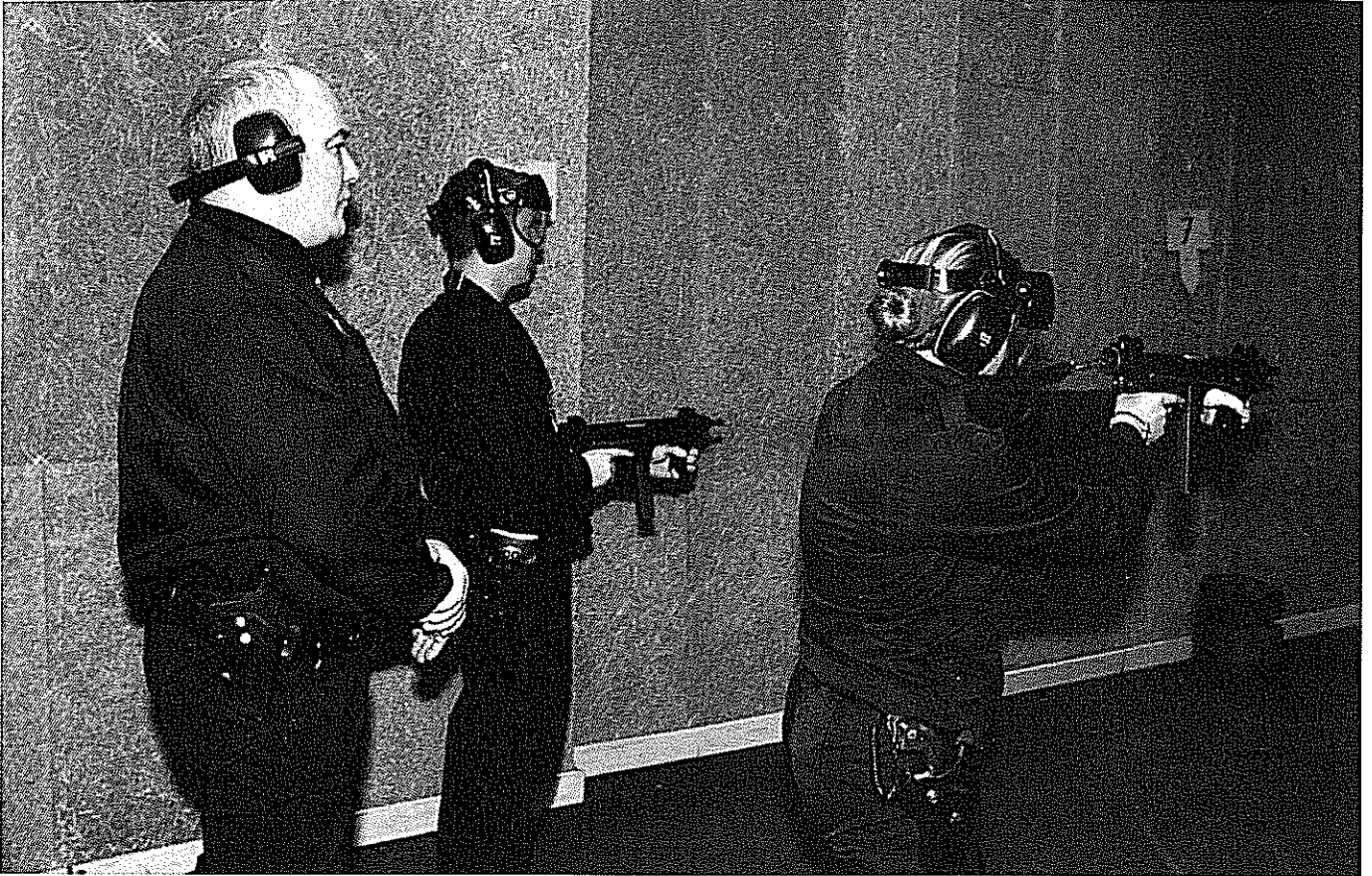
■ Gardiens de la paix hommes et femmes à l'entraînement au stand de tir - entraînement auquel les observateurs extérieurs peuvent être soumis en guise de rite de passage.

obtenir fut la demande d'autorisation officielle de passation du questionnaire. Pour contourner ce défaut de soutien de la hiérarchie policière, au plus haut niveau, nous avons fini par présenter le questionnaire comme une sorte d'audit sur les conditions de travail des policiers et sur leurs attentes en matière d'action sociale, autrement dit le logement, la restauration, la garde des enfants et les locaux, dont le traitement intéressait quasi exclusivement le ministère de l'Intérieur. Il a fallu faire de la place à ce nouveau questionnement. Quelques questions, plus politiques, ont par ailleurs été supprimées, à la demande de nos interlocuteurs à la direction administrative de la Police nationale (DAPN), par crainte que le questionnaire soit rejeté.