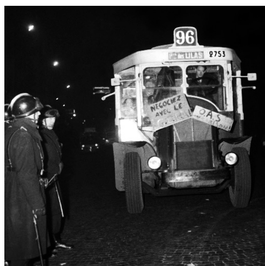
Manifestation anti-OAS: Bus 96, 19 décembre 1961.

journées d'études • mardi 11 & mercredi 12 février 2014 Campus de l'université Paris Ouest Nanterre • salle de réunion de la Bibliothèque de Documentation Internationale Contemporaine